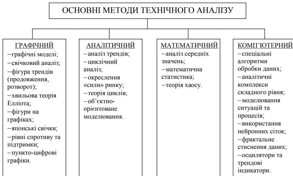
Рис. 2. Основні методи технічного аналізу