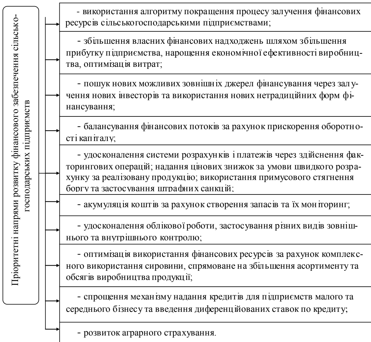
Рис.2. Пріоритетні напрями розвитку фінансового забезпечення фінансовими ресурсами сільськогосподарських підприємств