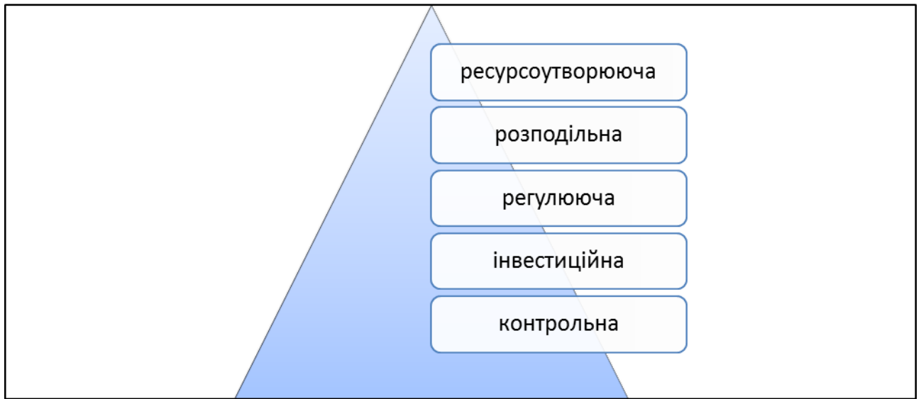
Рис. 2. Функції особистих фінансів в соціально-економічному ракурсі

При цьому, фінансові рішення про джерела доходу, про необхідність і метод формування грошових коштів, їх розмір і цільове призначення, час використання завжди приймаються самостійно фізичною особою. Таким чином, особисті фінанси завжди пов'язані з утворенням фінансових ресурсів через формування грошових доходів і фондів.